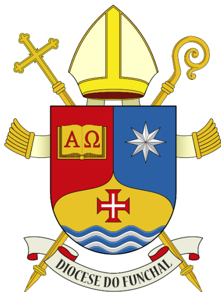
Brasão da Diocese do Funchal