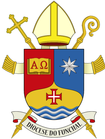
Brasão da Diocese do Funchal